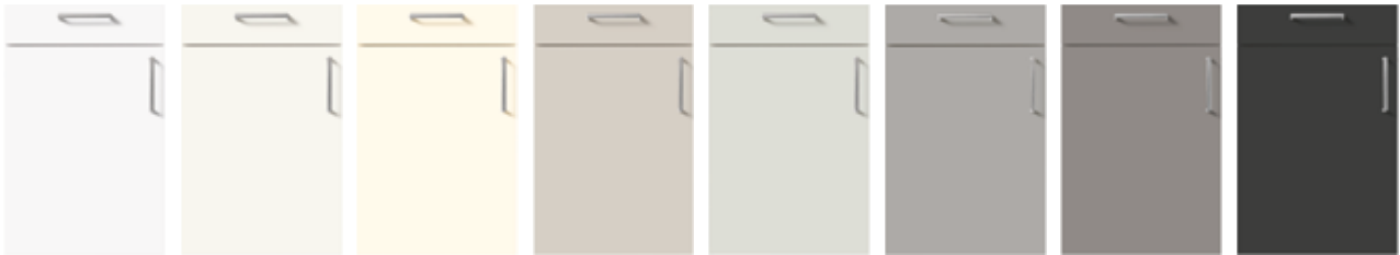
P091 Kristallweiß hochglanz