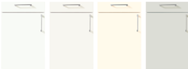
P091 Kristallweiß hochglanz