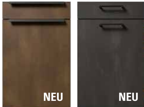
L592 Stahl bronze Nachbildung