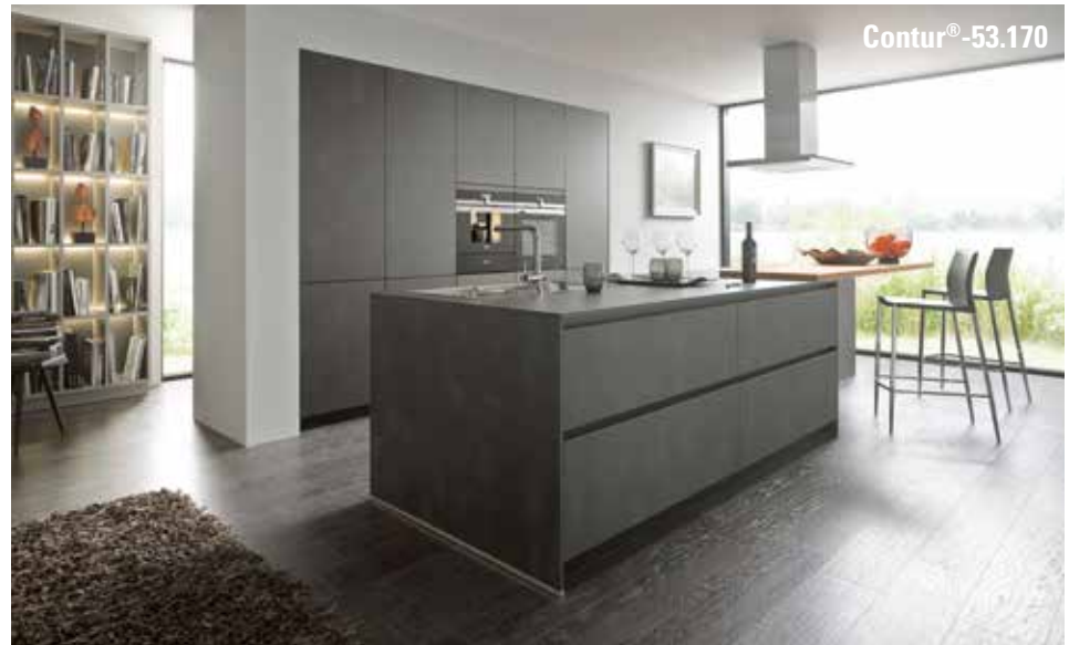
L587 Stahl dunkel Nachbildung